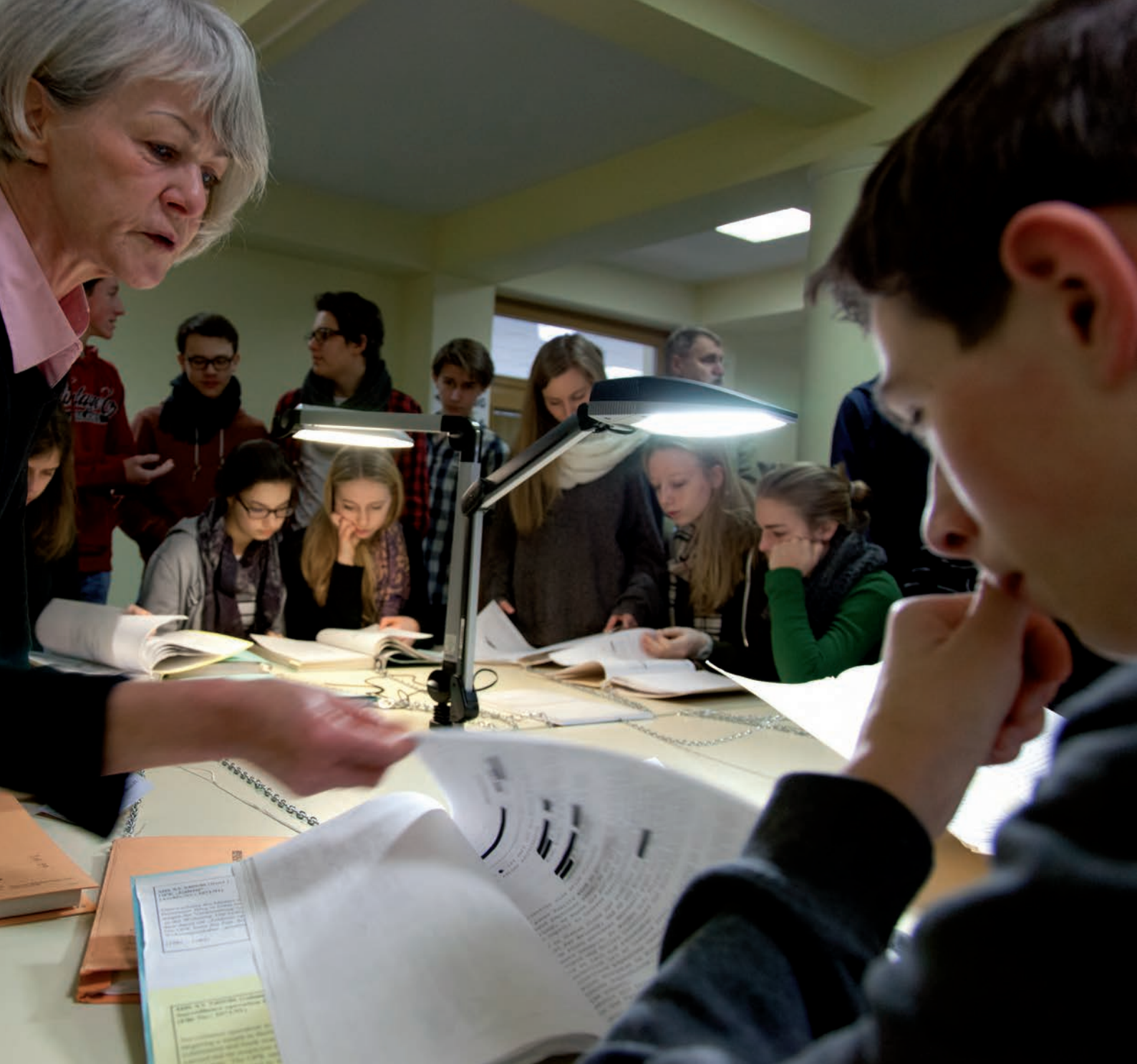
Schülergruppe bei einem Projekttag in der ehemaligen Zentrale des Ministeriums für Staatssicherheit in Berlin-Lichtenberg (Berlin, Januar 2013).