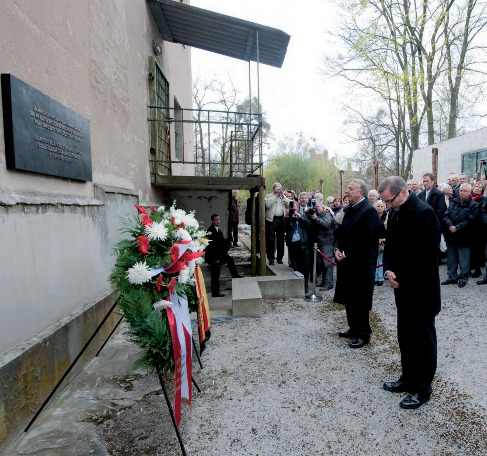
Kulturstaatsminister Bernd Neumann und der brandenburgische Ministerpräsident Matthias Platzeck bei der Eröffnung der Gedenk- und Begegnungsstätte Leistikowstraße (Potsdam, April 2012).