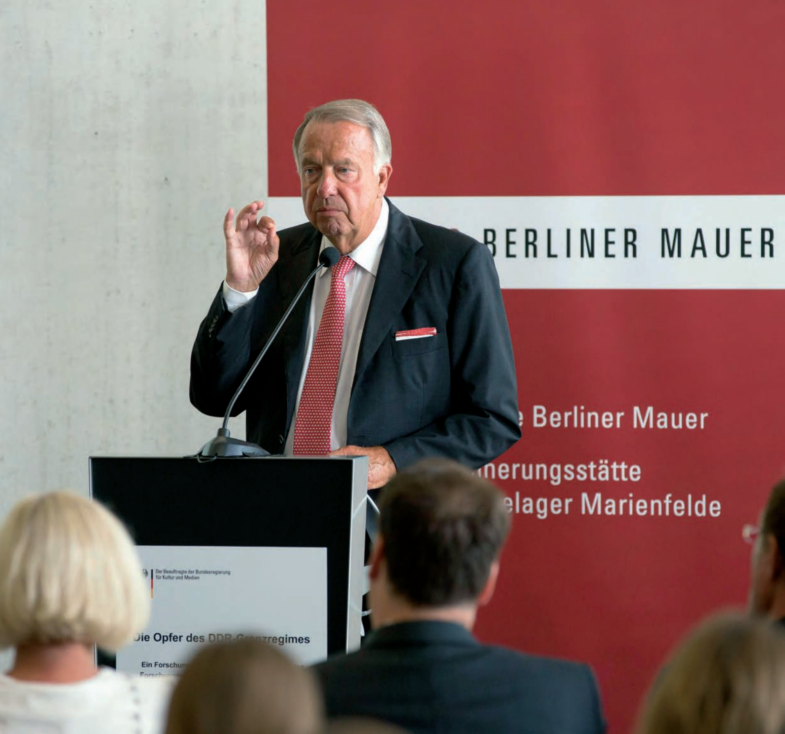
Kulturstaatsminister Bernd Neumann beim Start des Forschungsprojekts zu den Todesopfern an der früheren innerdeutschen Grenze in der Gedenkstätte Berliner Mauer (August 2012).