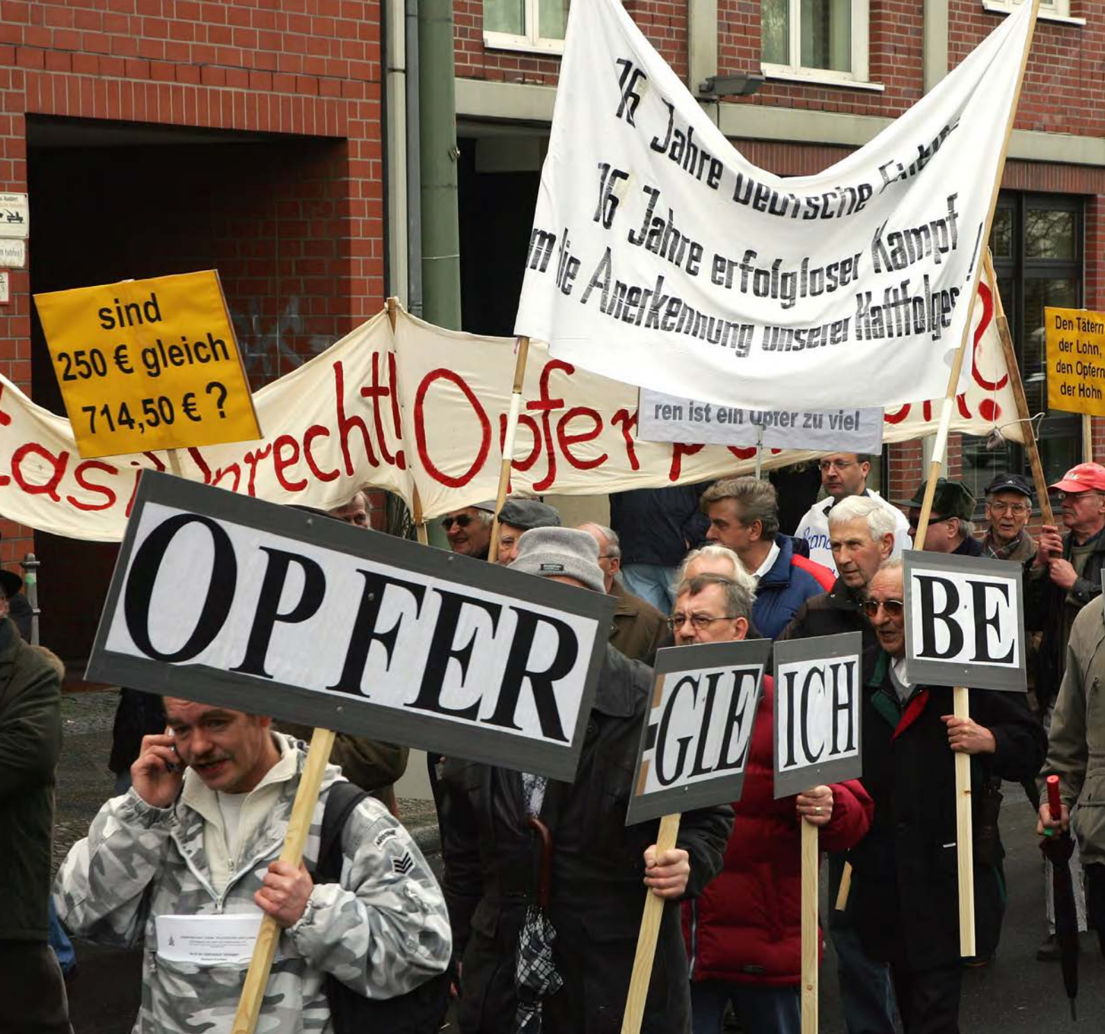
Demonstration für die Einführung einer Rente für die Opfer des SED-Unrechts (Berlin, 2007).