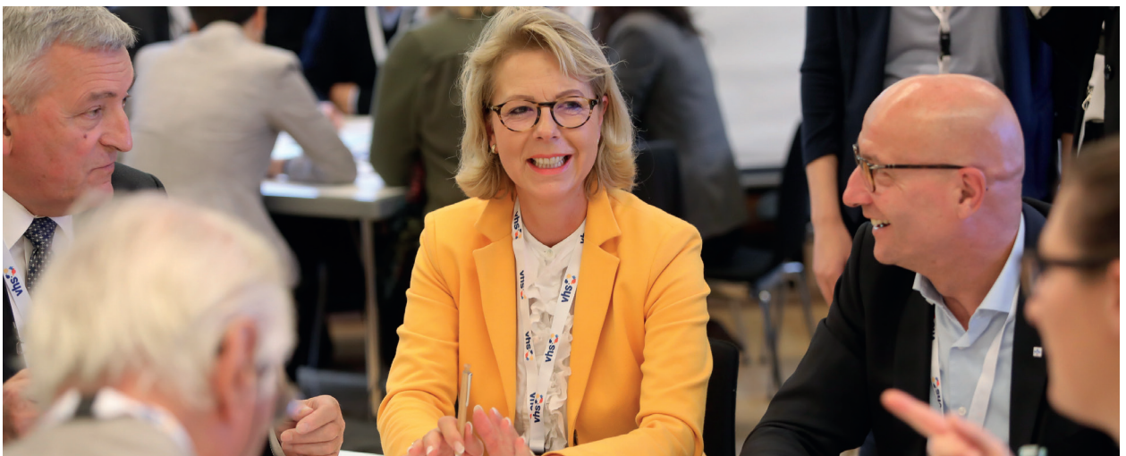
Intensive Diskussionen beim Workshop in Trier vor dem Dialog mit der Bundeskanzlerin am 8. Oktober 2018

Diese positive Grundhaltung ist für die Bundesregierung Anlass und Ansporn gleichermaßen, an der Stärkung und Fortentwicklung der Europäischen Union weiterhin entschlossen zu arbeiten. Lösungen entstehen in Europa immer gemeinsam. Deswegen werden die Mitgliedstaaten der Europäischen Union die Ergebnisse der nationalen Bürgerdialoge gemeinsam diskutieren und daraus ihre Schlüsse ziehen. Eine konstruktive gesamteuropäische Debatte über die Vorstellungen der Bürgerinnen und Bürger zur Zukunft Europas ist aus Sicht der Bundesregierung von großer Bedeutung – für den Erfolg der Europäischen Union als Garant von Frieden, Demokratie und Wohlstand.