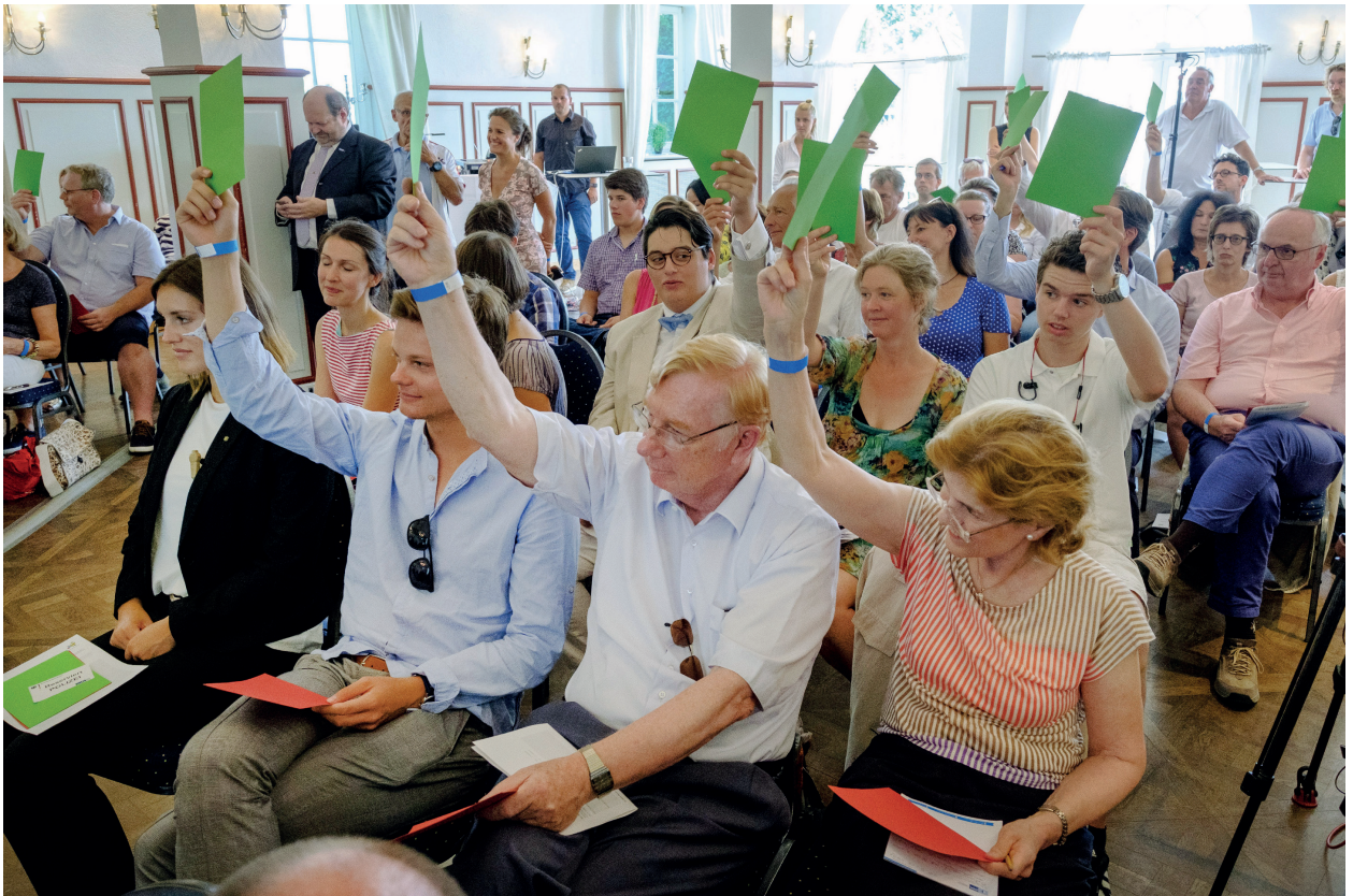
Aktive Teilnahme beim Dialog mit Wirtschaftsminister Altmaier am 20. August 2018 in Starnberg

Gleichheit kam in rund einem Viertel der Dialogveranstaltungen zur Sprache. Darunter verstanden die Bürgerinnen und Bürger eine Angleichung der Lebens- und Arbeitsverhältnisse, aber auch eine Harmonisierung von Regelungen und Strukturen innerhalb der Europäischen Union. Diese wurden insbesondere dann befürwortet, wenn sie das grenzübergreifende Leben und Arbeiten erleichterten. Dem Wunsch nach einer stärkeren Angleichung in verschiedenen Politikfeldern stand die Sorge vor Gleichmacherei innerhalb Europas und dem Verlust von kultureller, sozialer, politischer und wirtschaftlicher Vielfalt entgegen.