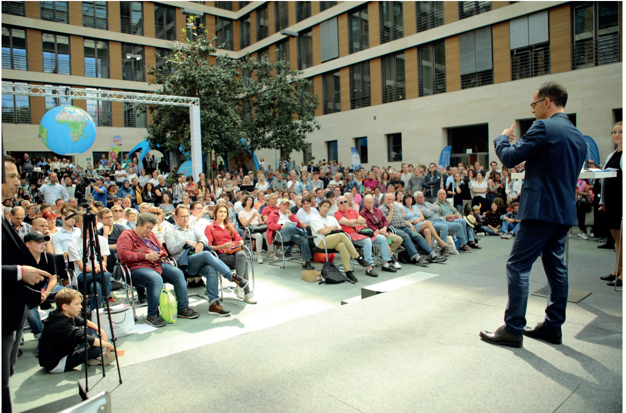
Reges Interesse beim Tag der offenen Tür der Bundesregierung: Außenminister Maas am 26. August 2018 im Lichthof des Auswärtigen Amts