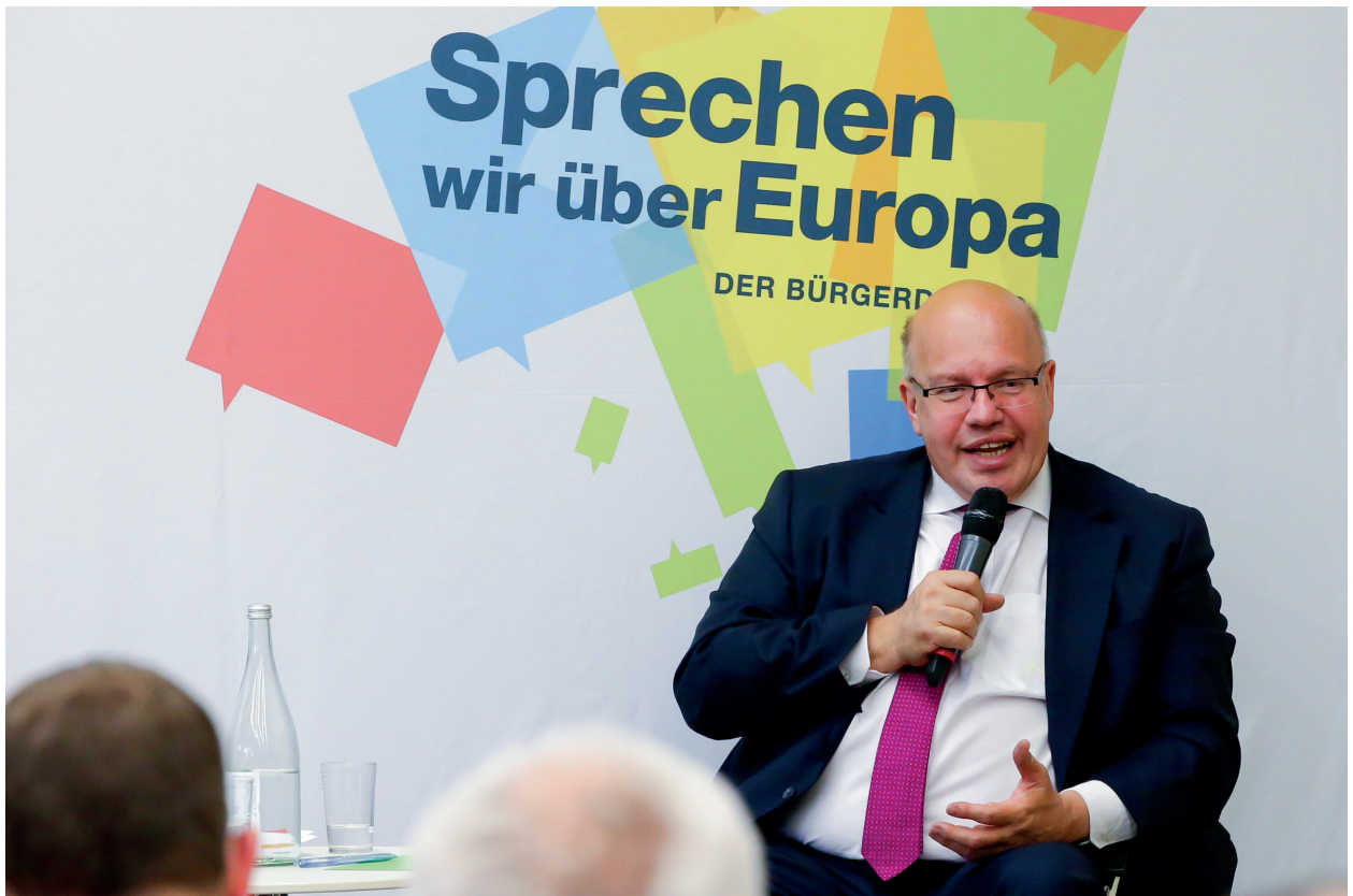
In Eberswalde diskutiert Wirtschaftsminister Altmaier am 10. Juli 2018 mit Bürgerinnen und Bürgern

des gebührenfreien Roamings in der Europäischen Union. Dagegen wurde beim Ausbau der digitalen Infrastruktur der größte Handlungsbedarf gesehen. Konkret nannten die Bürgerinnen und Bürger die europaweit flächendeckende Internetanbindung und eine stärkere Harmonisierung der Mobilfunknetze und -gebühren. Vereinzelt wurden die Digitalisierung der Arbeitswelt und der Bedarf nach einer verstärkten europäischen Zusammenarbeit in der Cybersicherheit thematisiert.