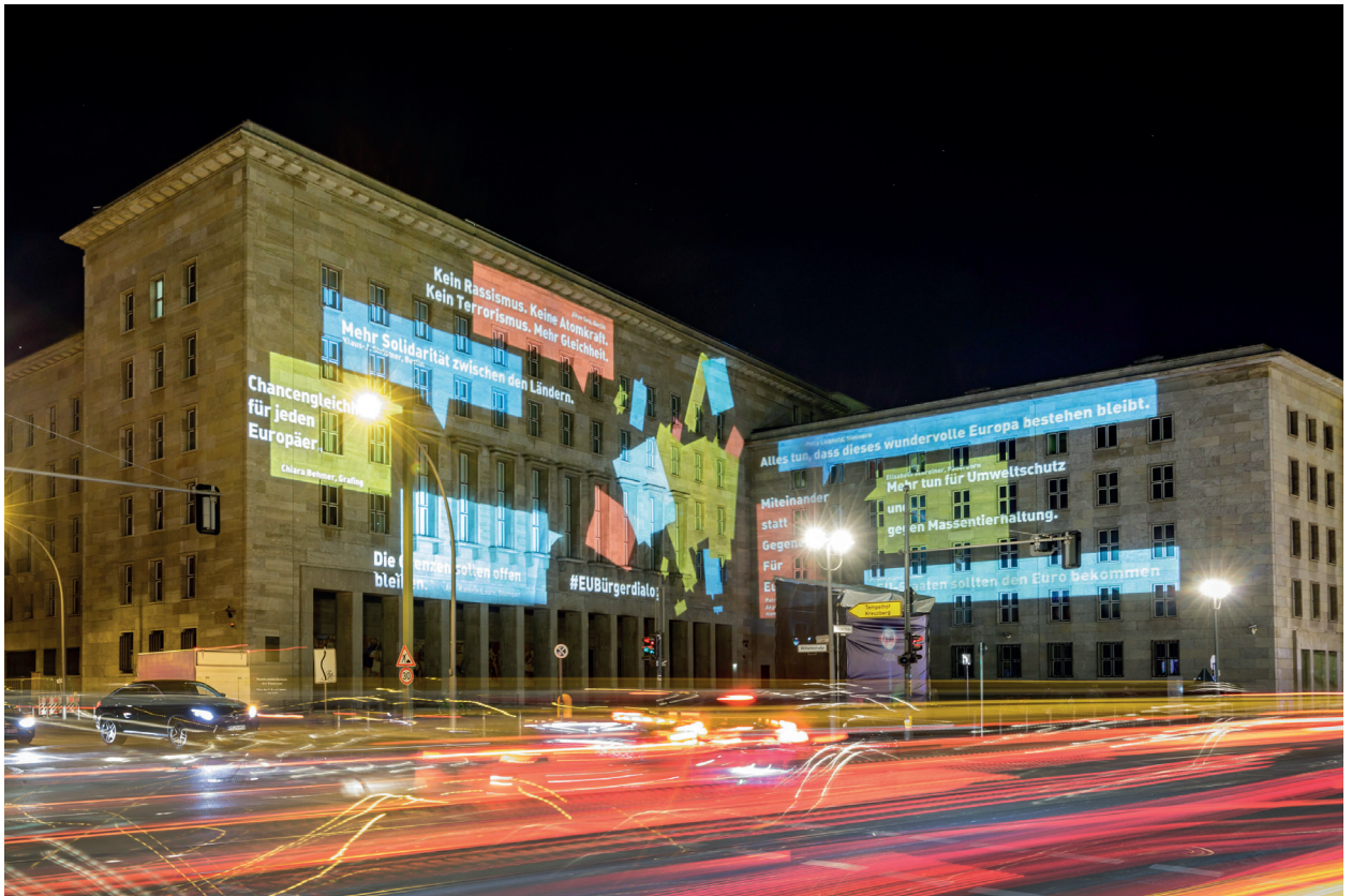
Das Gebäude des Bundesfinanzministeriums beim Festival of Lights 2018 europäisch beleuchtet

Im Rahmen des Festival of Lights 2018 projizierte das Bundesministerium der Finanzen Wünsche der Bürgerinnen und Bürger zur Zukunft Europas aus seinen Dialogveranstaltungen an die Fassade seines Dienstgebäudes.