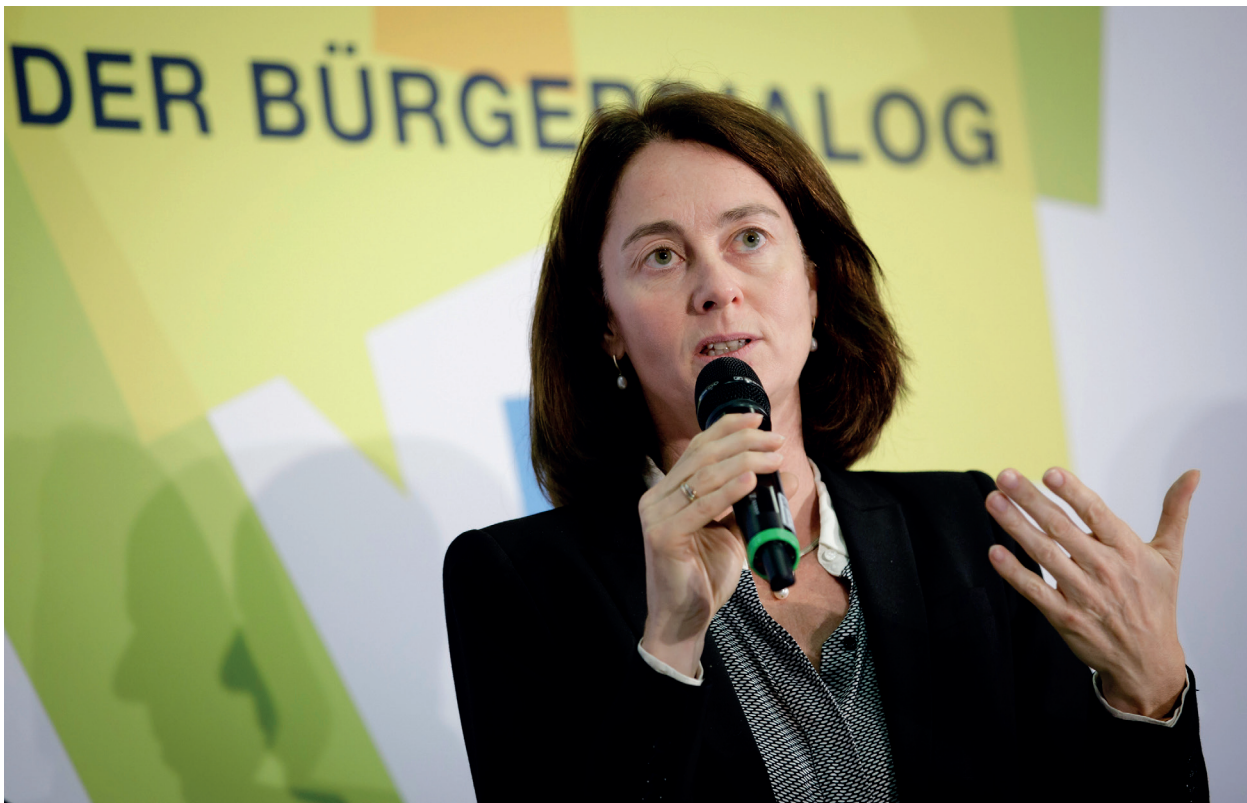
Justizministerin Barley im Gespräch am 25. September 2018 in Berlin

delsabkommen und Subventionen zulasten von Entwicklungsländern. Vielfach wurde auch der Wunsch nach nachhaltigerem Wirtschaften unter Beachtung von Umwelt- und sozialen Belangen geäußert.