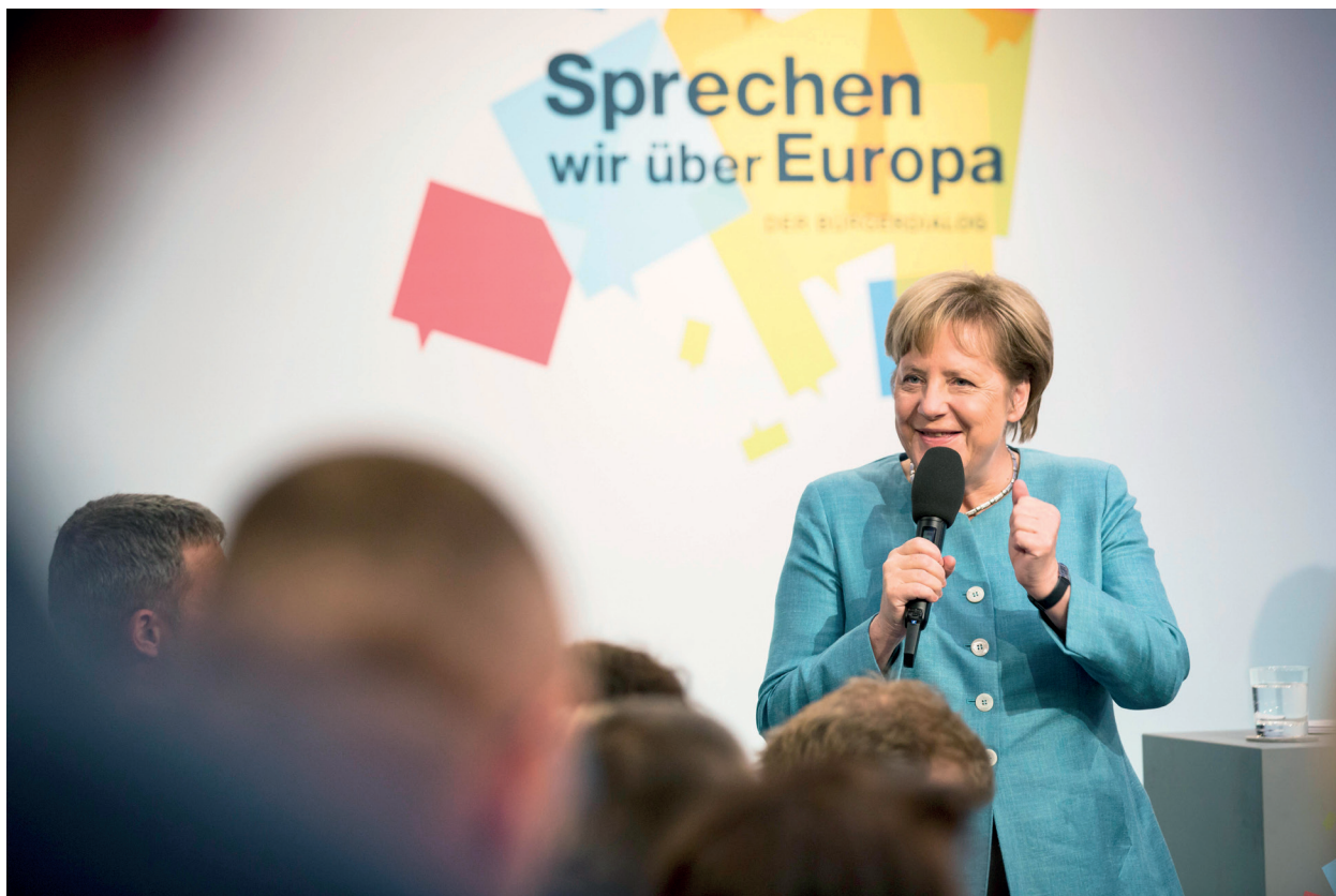
Bundeskanzlerin Merkel diskutiert am 14. August 2018 mit Bürgerinnen und Bürgern in Jena über die Zukunft Europas