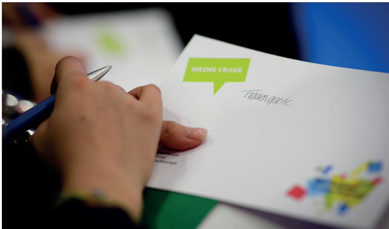
Eine Teilnehmerin beim Dialog mit Justizministerin Barley am 25. September 2019 bereitet ihre Frage vor

Wesentliche Säulen der seitens der Bundesregierung vorgegebenen Auswertungsmethode war eine Kategorisierung der in den Protokoll- und Rückmeldebögen dokumentierten Aussagen der Bürgerinnen und Bürger. Die Auswertung erfolgte auf Basis wissenschaftlicher Methoden und Prinzipien: Unabhängigkeit, intersubjektive Nachvollziehbarkeit, Gründlichkeit und Transparenz. Mit einer softwaregestützten Text- und Inhaltsanalyse (Text Mining) konnten die unabhängigen wissenschaftlichen Auswerterinnen und Auswerter der Vielfalt der Beiträge gerecht werden und sicherstellen, dass tatsächlich jede Aussage und Diskussion aufgenommen und in der Auswertung gleichermaßen berücksichtigt wurden. 6 Damit ließen sich die am häufigsten diskutierten Themenfelder und die mittels Text Mining zugewiesenen Unterthemen identifizieren und detailliert beschreiben.