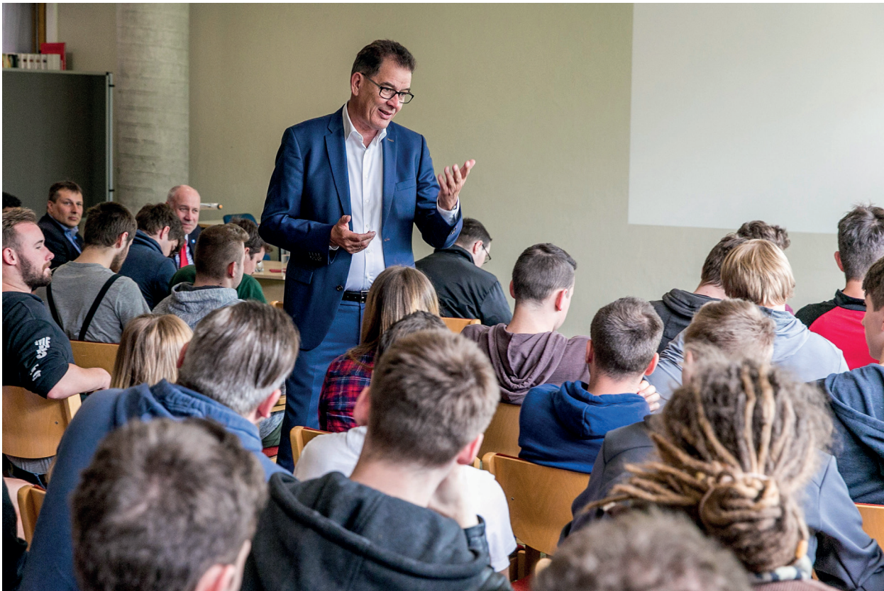
Entwicklungsminister Müller in einer Berufsschule am 4. Mai in Kempten