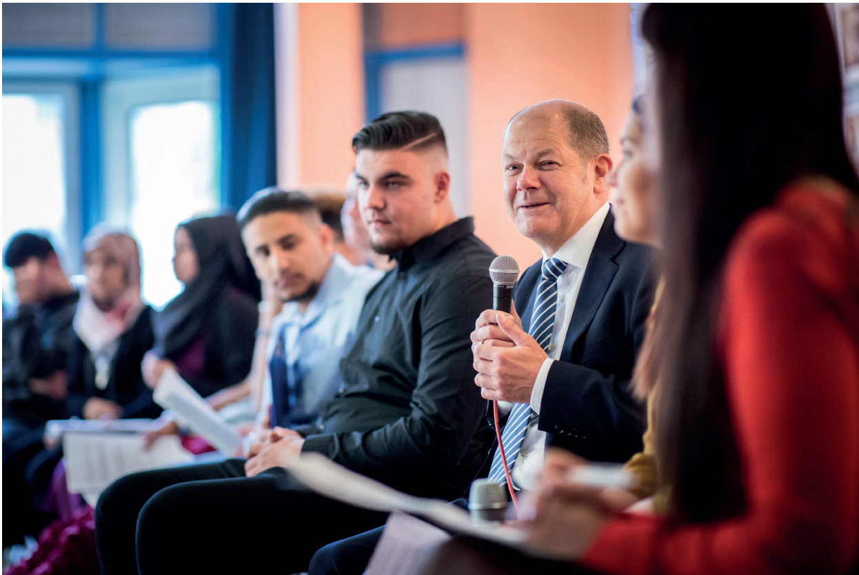
Finanzminister Scholz an der Refik-Veseli-Schule in Berlin-Kreuzberg am 4. Mai 2018

rung auch beim Thema Zukunft Europas fortgesetzt. Eine Vielzahl der Dialogveranstaltungen fand in den Räumlichkeiten der örtlichen Volkshochschulen als World Café oder Café Europa 3 mit 20 bis 100 Teilnehmenden statt. In Leipzig kamen Bürgerinnen und Bürger zu einer Diskussionsveranstaltung in einer Straßenbahn zusammen, die Volkshochschule Datteln wählte ein Museumsschiff als Veranstaltungsort und auch in Castrop-Rauxel wurde auf einem Schiff diskutiert. In Stuttgart nutzte man eine Busfahrt zur Europäischen Zentralbank in Frankfurt am Main, um über die Leitfragen des Bürgerdialogs ins Gespräch zu kommen. Die Europäische Akademie in Sankelmark diskutierte über die Zukunft Europas im Europazug, einer Dampflok, die zwischen Kappeln und Süderbrarup an der deutsch-dänischen Grenze verkehrt. Beim Bürgerdialog mit der Bundeskanzlerin in Kooperation mit der Volkshochschule Trier kamen die