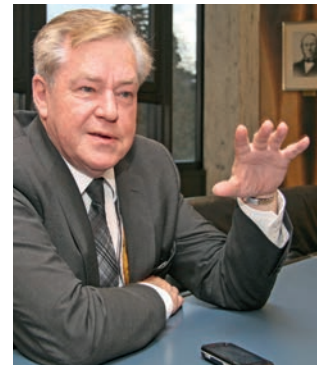
Hans-Jürgen Beerfeltz Der Staatssekretär des Bundesministeriums für wirtschaftliche Zusammenarbeit und Entwicklung