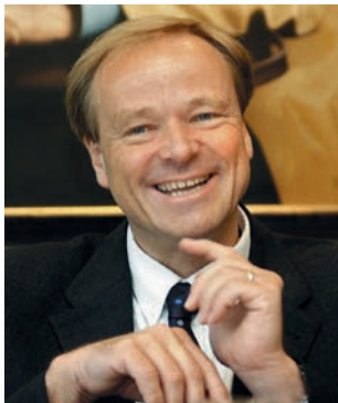
Dirk Niebel, MdB Bundesminister für wirtschaftliche Zusammenarbeit und Entwicklung

Mehr Wirksamkeit Mehr Sichtbarkeit Mehr Engagement Mehr Wirtschaft Mehr Bildung Mehr Demokratie