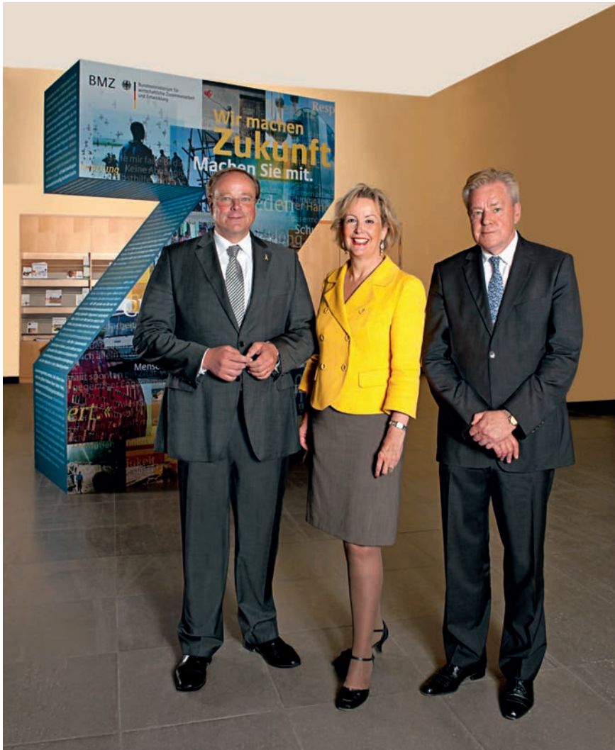
Dirk Niebel, MdB

Bundesminister für wirtschaftliche Zusammenarbeit und Entwicklung