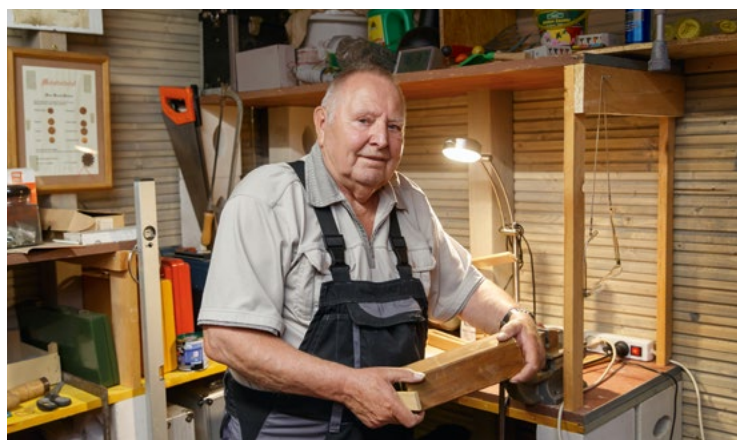
Aktiv bleiben in der Werkstatt