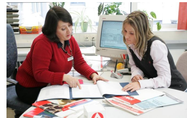
Die Arbeitsagenturen vor Ort betreuen und vermitteln Arbeitssuchende heute besser

Geringere Lohnnebenkosten entlasten auch Arbeitgeber. Dadurch entstehen Spielräume für neue Arbeitsplätze.